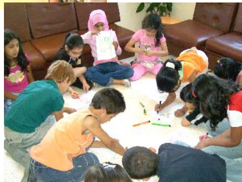
نشاطات تربوية و ترفيهية للأطفال