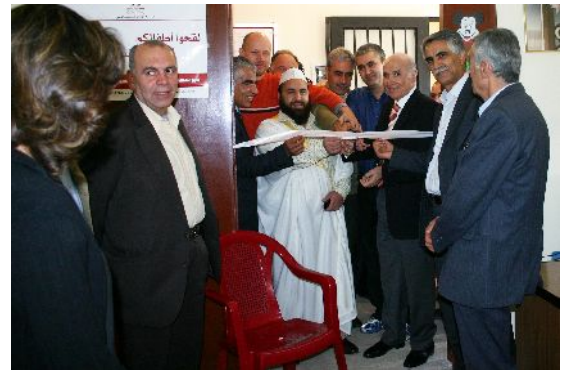
إعادة افتتاح المركز عام 2008